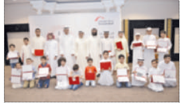
فائزو مسابقة «رتل بإتقان» خلال رمضان

برز مهرجان الكويت للقهوة كواحد من اهم الفعاليات التي شهدتها الكويت في مطلع عام 2018 والذي استقطب نحو 50 مشروعا من مشاريع الشباب الكويتي في مجال القهوة (الكافيات) والتي انتشرت في الونة الاخيرة حيث استقطب المهرجان أكثر من 50 ألف زائر على مدار يومين في حديقة الشهيد. كما نظم البنك أكبر بطولة للعبة البالي ستيشن فيفا 2018 سجل فيها أكثر من 2500 شاب تمت تصفياتهم بالقرعة الى حوالي 300 مشارك تحافسوا على مدار يومين في الافنيوز بحضور بطل العالم