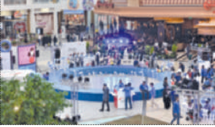
حملة «قيس حلتك بالأفنيوز»

اطلق بنك «غيتهاوس» البريطنياني» منتج تمويلياً جديداً يتيح للعلاء الاستفادة من امتلاك العقارات بهدف السكن في المملكة المتحدة وذلك بعد حصوله على كل الموافقات اللازمة، الجهات المختصة، وأوضح البنك في بيان صحفي ان البرنامج يتوافق مع احكام الشريعة الإسلامية، كما انه سيكون بديلاً للرهن العقاري المتعارف عليه، كما سيتيح برنامج التمويل المذكور فرصة تملك العقارات السكنية مباشرة من البنك، ونظراً لكون هذا المنتج يتوافق مع احكام الشريعة الإسلامية، فإن البنك بدوره لن يتقاضى أي فائدة، انما سيقوم البنك بعملية التمويل من خلال صيغة الاجارة الثمينة بالتملك، حيث سيقوم العميل بسداد القيمة الايجارية للبنك باجل محدد حتى يتملك العقار كاملاً بعد الاقراض من سداد اجمالي قيمة التمويل. وذكر البنك ان الهدف الرئيسي لهذا المنتج هو تسهيل حصول العلاء الراغبين بالسكن على احتياجاتهم