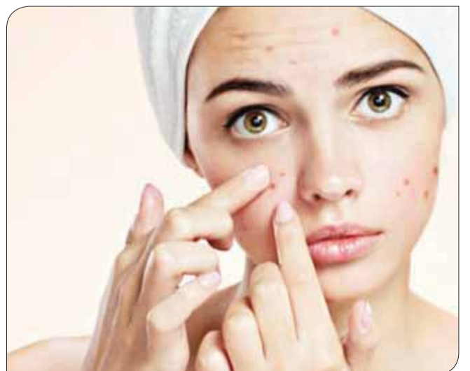
للمهرمون دخل كبير في زيادة شدة حب الشباب.

سمرار في رقيبتها وفرط في نمو شعر الجسم فهذا دليل وجود اختلال هرموني. فقد يكون سبب حب الشباب هو تكيس المبايض واختلال معدل الهرمونات في الجسم. وهذه الحالة تحتاج للعلاج من قبل طبيب امراض نساء اولا قبل علاج حب الشباب. اما لو كان احد والدي البنت عانى نوعاً شديداً من حب الشباب وخلف ندبات في الوجه، فذلك دليل على انها قد تكون مصابة بحب الشباب الشديد ويجب علاجه بشكل مكثف لتفادي المضاعفات».