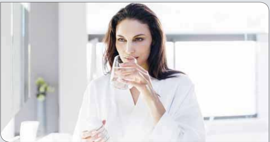
بعض النساء يحتجن تناول مكملات غذائية