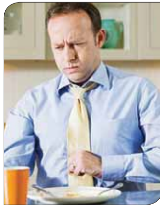
قهوة و الاطعمة الدسمة يزيد اعراض الارتجاع.

السؤال: ما اهم الفيتامينات التي تنصح المرأة بتناول مكملاتها الغذائية؟ الاجابة: يعتمد الامر على نوعية التغذية واسلوب الحياة، ولا يخلو الامر من شرط استشارة الطبيب اولا حتى يقيم الحاجة لتناول اي مكمل غذائي. ويشكل عام هناك اتفاق بين خبراء التغذية على عدة ارشادات صحية: حيث تنصح التي تحاول الحمل ان تبدأ بتناول مكمل غذائي يحتوي على 400 mcg من حمض الفوليك يوميا، وذلك خلال الفترة السابقة للحمل ولمدة 12 اسبوعاً من بدء الحمل. فحمض الفوليك يدعم عمليات تكون الجنين ويقلل فرصة الاصابة بعدة تشوهات خلقية جينية واصابة الحامل بالانيميا وامراض القلب وبعض انواع السرطانات ايضا. كما تنصح